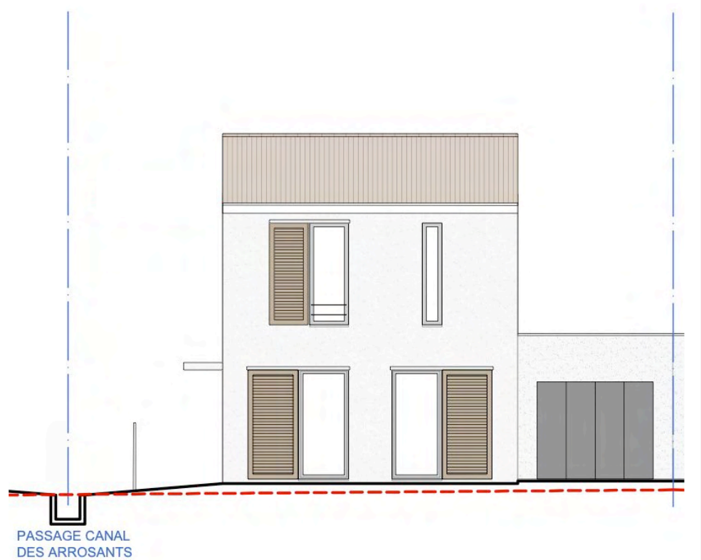
Façade sur rue