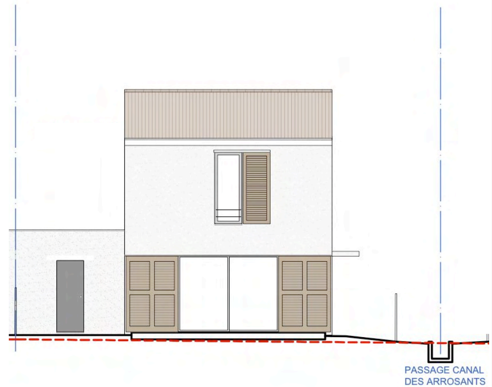
Façade sur jardin