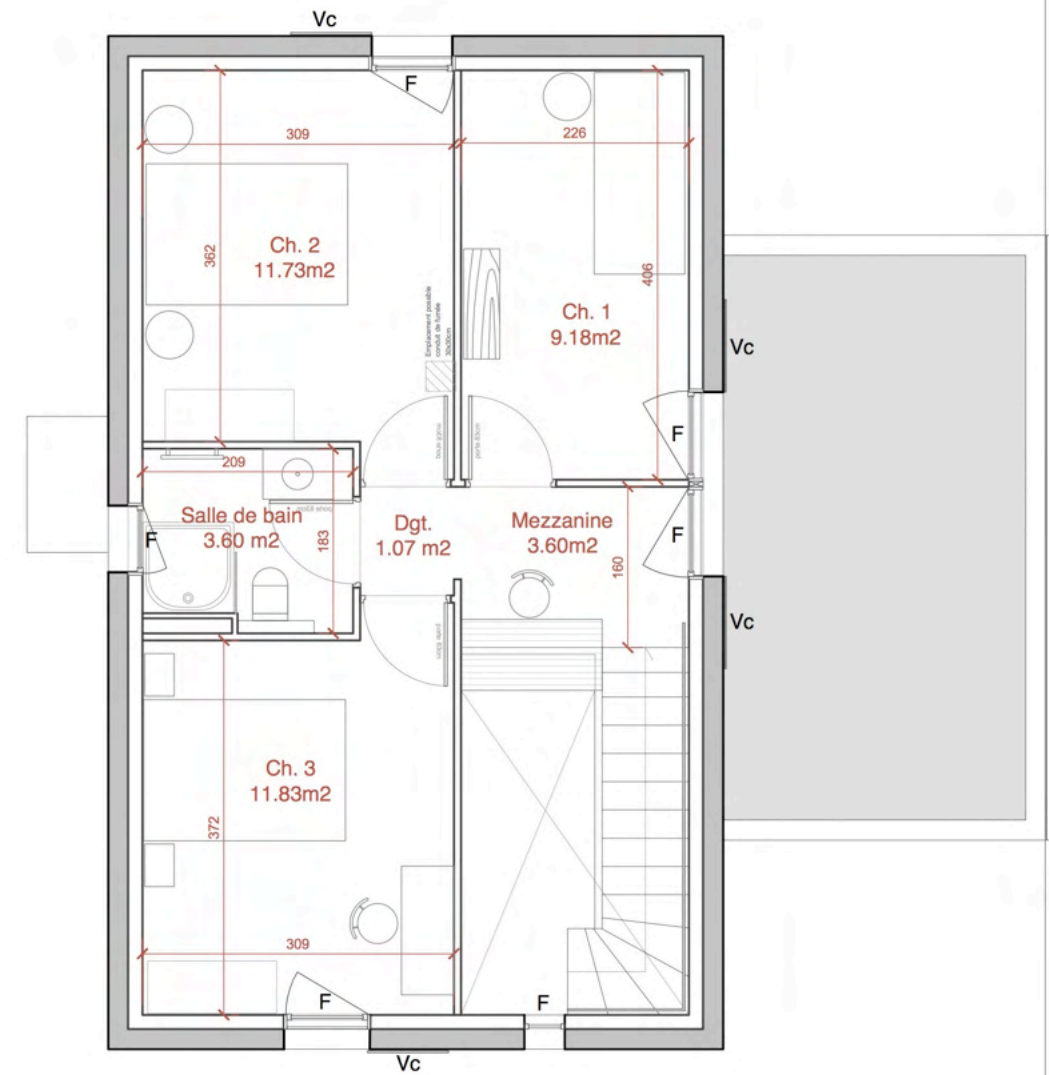
Plan niveau 1 - 1/75e